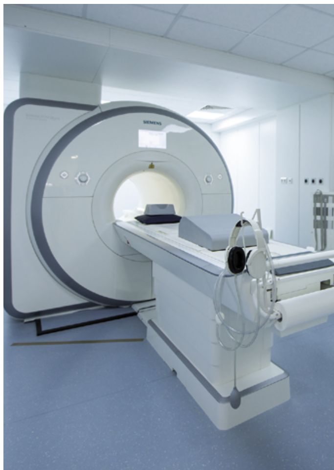
MRT 3 Tesla Hochfeld mit großer Patientenöffnung